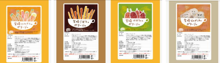
にんじん ごぼう かぼちゃ じゃがいも

平成 30 年 5 月に冷製スープの製造に成功しました！詳細は、またお知らせします。