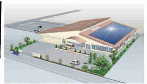
充実した設備と木のぬくもりに包まれ、1日1日をゆっくりと安心して楽しく過ごせる施設です。