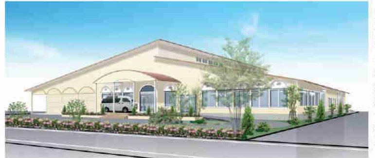
「はながしま」完成予想図