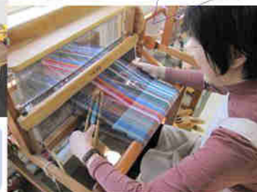
《さをり織り》 丁寧に、心を込めて織って います