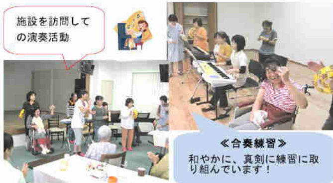
《合奏練習》 和やかに、真剣に練習に 取り組んでいます！