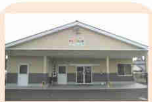
地域活動支援センター ↑ なみき

共同生活事業所（としみホーム：定員8名）、和室、洋室があり、エアコン完備の部屋でゆっくりとくつろげます。地域活動支援センター（なみき）では様々な生産活動やレクレーションに取り組んでおり、合奏、ピアノ演奏などは近くの施設を訪問し、緊張の中にも楽しく練習の成果を発表したりしています。その他に調理、さをり織り、壁画制作、季節の行事を取り入れた活動、外出など多彩な内容で活動しています。