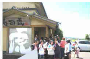
寿司虎でお寿司をお腹いっぱい堪能しました。